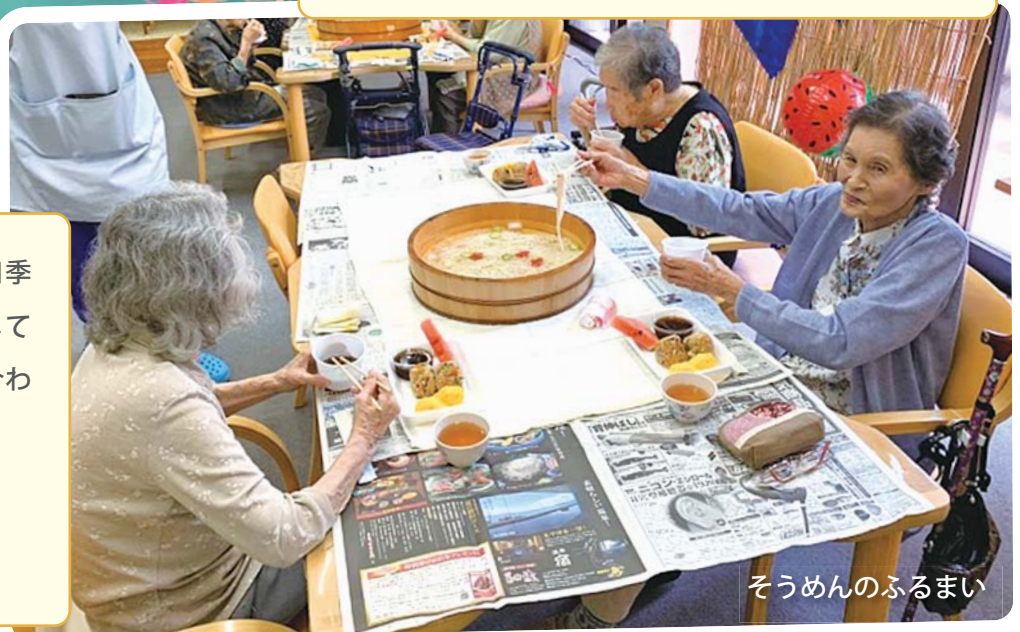
そうめんのふるまい

金魚すくい、ヨーヨー釣り、大正琴の披露、みんなで盆踊り、ビンゴゲーム、かき氷コーナーなどなど盛りだくさんの内容でした。利用者の皆さんにも大変喜んでいただきました。