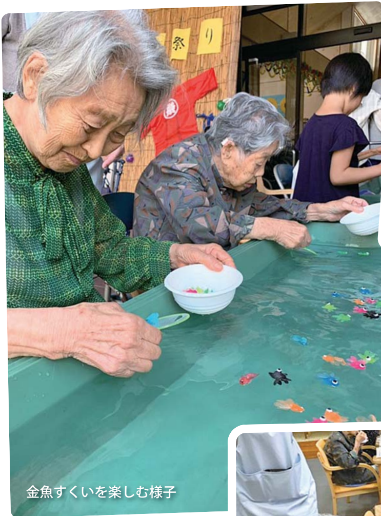
金魚すくいを楽しむ様子